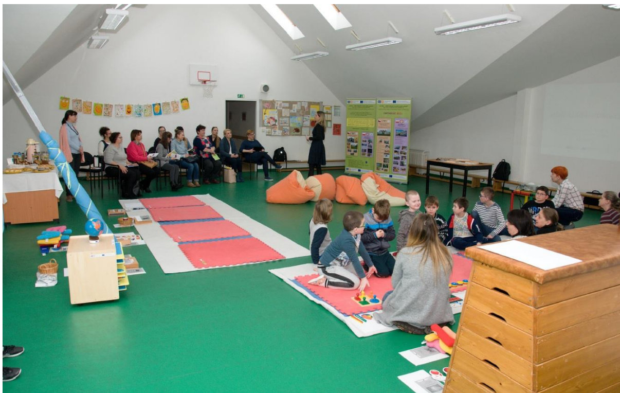
Foto z Montessori workshopu.

V další části projektu byl připraven workshop, tentokrát na ZŠ Dostojevského, šlo o Montessori workshop rozdělený do 4 částí. Smyslové, matematické, jazykové a kosmické výchovy. Které si vyzkoušeli i děti z Ratiboře. Poté následovala prohlídka centra Opavy.