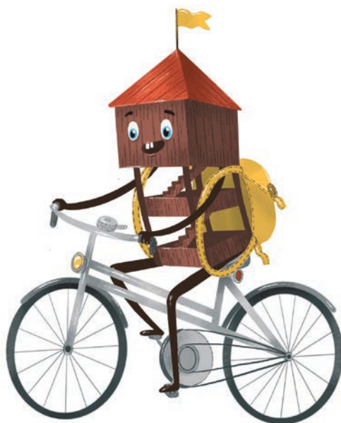
Illustrations © Karolína Mlčochová, 2021

– Polsko. Na příští rok se tak mohou návštěvníci těšit mj. na outdoorovou hru „Poznej naši Silesianku!“, která bude představena na různých akcích na obou stranách hranice. Tak neváhejte a vzhůru do oblak!