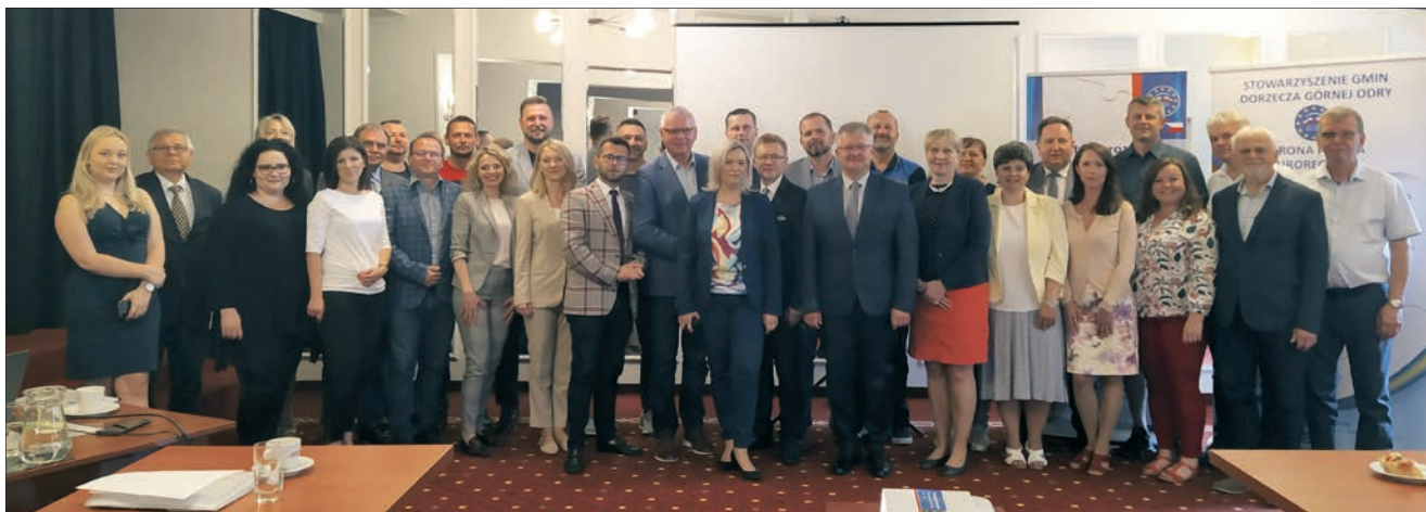
Ve dnech 9. – 10. června 2022 se v Szczyrku konalo společné dvoudenní setkání zástupců členských obcí a měst a přidružených členských organizací Euroregionu Silesia, jehož hlavním cílem bylo seznámit účastníky s novou Strategií rozvoje Euroregionu Silesia a podmínkami evropské územní spolupráce v období 2021-2027.

Kompletní strategický dokument a informační leták prezentující hlavní body tohoto dokumentu jsou k dispozici na internetových stránkách Euroregionu Silesia http://www.euroregion-silesia.cz