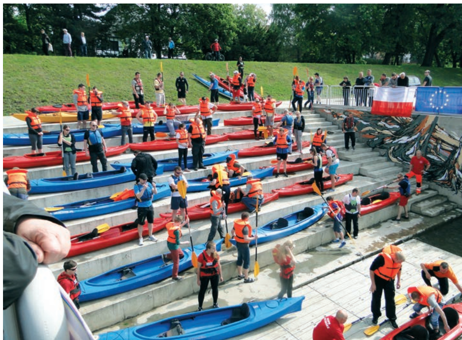
Jedna z vodáckých akcí na Odře v Ratiboři

pek do Ratiboře měli vyhradit zhruba šest hodin. V tomto úseku se nacházejí místa, kde lze plavbu ukončit anebo přerušit, a to na stanovištích vybudovaných poměrně nedávno: v Zabelkowě a Krzyżanowicích. Samotné doplutí