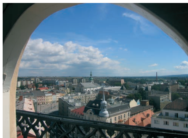
Městská věž Hláška v Opavě nabízí výhledy na centrum města a za dobré viditelnosti i na vrcholky Hrubého Jeseníku s Pradědem a Nížkého Jeseníku – Malý a Velký Roudný.