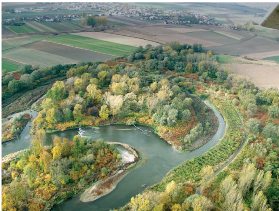
Hraniční meandry Odry

Vodácká sezóna trvá na Odře od jara do podzimu. Organizaci plaveb zajišťují samosprávy i místní kajakářští nadšenci. Mimoto existuje možnost individuálního zapůjčení potřebného vybavení v místních kajakářských klubech. K největším vodáckým slavnostem na Odře patří Pływadło a Meander Orient Express .