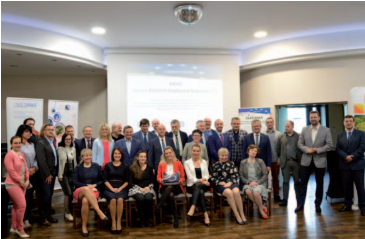
V roce 2020 se Euroregion Silesia ujal organizace XXVII. Fóra polských hraničních regionů. Dvoudenní setkání zástupců polských sdružení tvořících euroregiony se uskutečnilo ve dnech 1. - 2. října 2020.