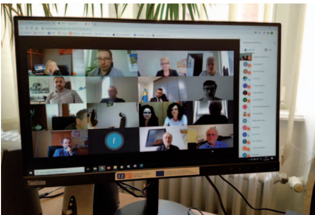
V roce 2020 se z důvodu omezujících opatření proti šíření koronaviru zasedání Euroregionálního řídicího výboru Euroregionu Silesia konala pouze v podobě videokonferencí.

Na realizaci Fondu i samotných projektů mají od loňského roku, bohužel, dopad omezující opatření proti šíření kononaviru. Nově bylo nutné zavést možnost alternativní formy jednání Euroregionálního řídicího výboru např. prostřednictvím videokonferencí. Žadatelé mají možnost vedle telefonických a mailových konzultací nově využít i on-line konzultací, které v době omezených mezilidských kontaktů dostatečně nahradí osobní konzultace na sekretariátech euroregionu. Pro realizaci projektů byla nově zavedena možnost realizace i po dobu delší než dosavadních maximálních 18 měsíců, pokud epidemiologické nebezpečí po určitou dobu neumožňuje jejich realizaci a pokud toto schválí Euroregionální řídicí výbor. Takové změny harmonogramu jsou operativně projednávány formou oběžné procedury. Ze stejných důvodů může být také po dohodě s příslušným Správcem Fondu upravena podoba či rozsah některých klíčových aktivit, které nelze při stanovených omezujících opatřeních realizovat v naplánované podobě. Bohužel, změnit např. podobu klíčové aktivity z prezenční na on-line s ohledem na charakter aktivity, cílovou skupinu či cíle projektu není vždy možné, a tak se realizace mnoha projektů, které již měly být ukončeny, prodlužuje. Naštěstí nejzazší termín ukončení všech projektů financovaných z Fondu mikroprojektů je stanoven až na prosinec 2022, takže lze předpokládat, že se podaří všechny projekty včas zrealizovat a prostředky Fondu vyčerpat v maximální možné míře.