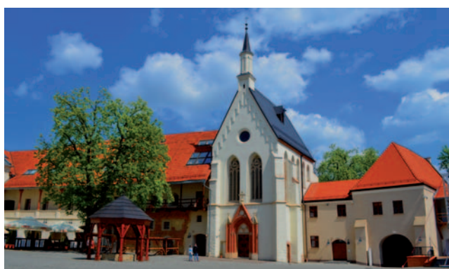
Nádvoří Piastovského hradu v Ratiboři.

Na polské straně Euroregionu Silesia lze navštívit Piastovský hrad v Ratiboři , dávném hlavním městě Horního Slezska. Hrad byl již v 9. století sídlem úřadu kastelána a v 2. polovině 12. století patřil knížeti Mieszku Laskonozce, který byl jedním z panovníků Polska v době rozpadu státu na jednotlivé údíly. Kolem roku 1290 nechal kníže Přemysl postavit gotickou kapli, která byla zasvěcena sv. Tomáši Becketovi z Canterbury, anglickému mučedníkovi. Kaple je poměrně dobře zachovaná a dnes je nejcenějším objektem tohoto typu v Polsku. Je nazývána perlou hornoslezské gotiky a také – s ohledem na podobnost se slavnou pařížskou kaplí – slezskou Saint Chapelle . Hrad stejně jako město Ratiborž měl po staletí pohnuté dějiny. Po válce byl znárodněn a chátral. V posledních letech byl zrekonstruován a kaple prošla celkovou renovací. V průběhu celého roku hrad nabízí návštěvníkům nejrůznější výstavy a akce.