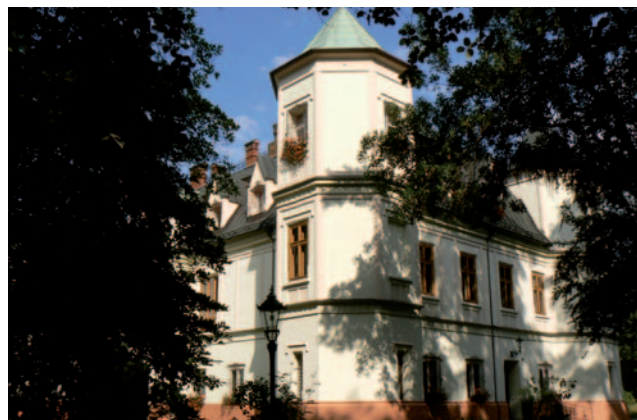
Zámek v Krzyżanowicích

vík van Beethoven. Objekt je obklopen parkem a zdí s historickou budovou brány. S ohledem na funkci této památky je její přístupnost návštěvníkům omezena. Možné jsou však procházky po okolním parku a návštěva zámecké kaple.