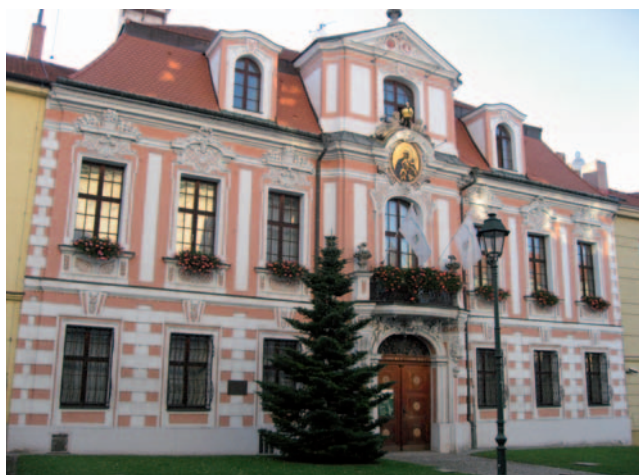
Pozdně barokní Sobkův palác v Opavě.

Kromě hradů a zámků obklopených parky si pozornost zaslouží i opavské paláce, jakými jsou Blücherův palác , Sobkův palác či Palác Razumovských , které dne slouží jako sídla různých institucí.