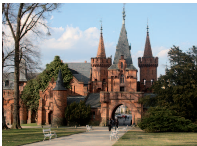
Hlavní vstupní brána zámeckého areálu v Hradci nad Moravicí.

Zámecký areál v Hradci nad Moravicí , nazývaný „perlou Slezska“, patří k nejatraktivnějším objektům na území Euroregionu Silesia. Vznikl v místě slovanského hradiště kmene Holasiců z 8. století. Jsou zde dva zámky – starší Bílý zámek a novogotický Červený zámek s hlavní vstupní branou, dále stavba zvaná Bílá věž a park v anglickém stylu o rozloze přes 100 hektarů. Bílý zámek byl od konce roku 1778 rodovým sídlem rodu Lichnovských. Poslední přestavba objektu proběhla v 2. polovině 19. století. V té době také vznikl areál Červeného zámku, který je kopií staroněmeckého středověkého hradu. Zámek v Hradci je spojován především s hudbou. Pobývali zde takoví hosté jako Ludvík van Beethoven, Franz Liszt a Niccolò Paganini. Ve Velké dvoraně Červeného zámku se každoročně koná mezinárodní interpretační soutěž Beethovenův Hradec, která patří k nejvýznamnějším kulturním událostem pořádaným v rámci celé České republiky. Po druhé světové válce byla usedlost rodu Lichnovských znárodněna. V současné době prostory Bílého zámku nabízejí několik prohlídkových okruhů, v rámci kterých mohou návštěvníci shlédnout reprezentační a soukromé salony, hostinská apartmá, zámeckou kapli či erbovní sál. V Červeném zámku je kromě Velké dvorany hotel a stylová restaurace.