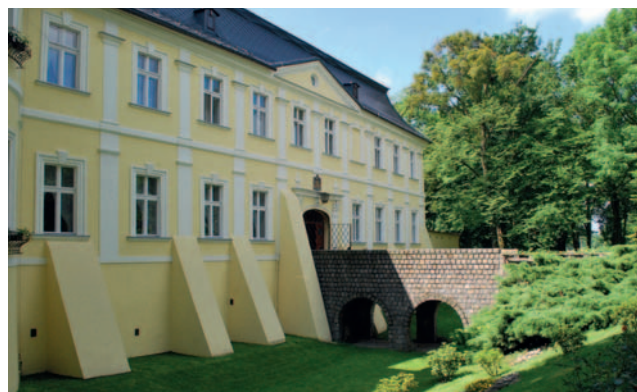
Zámek v Chalupkách.

Zámek v Chalupkách , který je často nazýváme i hradem, stojí v sousedství hraničního mostu na Odře. První zmínky pochází z roku 1373, kdy plnil úlohu pevnosti. V průběhu staletí měnil své majitele a do roku 1742 byl součástí dnes českého Bohumína. Od poloviny 19. století patřil světoznámé bankéřské rodině Rothschildů. Budova prošla mnoha přestavbami, naposledy v roce 1907. Nyní má zámek barokní charakter s dochovanými dřívějšími relikty. Je vidět pevnostní prvky, především část příkopu, který zámek obklopoval, a také stopy dávného bastionového opevnění. Nad hlavním vchodem se nachází litinová deska s erbem Rothschildů. Kolem parku je malý, ale krásný park z 19. století, kde roste kolem 30 druhů a odrůd stromů a keřů. V současné době zámek slouží jako hotel a restaurace.