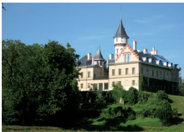
Zámek v Raduni.

kům. Nabízí dvě návštěvnické trasy: první prezentuje život šlechty na venkově, druhá pak vede do soukromých komnat rodiny Blücherů.