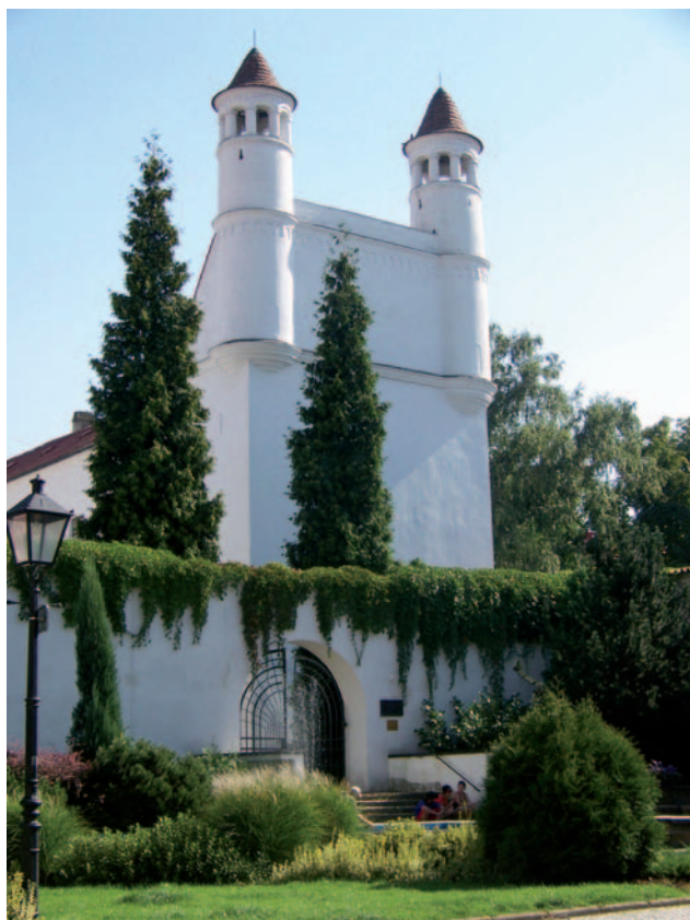
Žerotínský zámek v historickém centru Nového Jičína.

Zámek v Novém Jičíně byl postaven v polovině 16. století v místě původního gotického hradu z dob středověku. V dějinách měl různé funkce – byl usedlostí majitelů, sídlem městské radnice a také zde byla nějakou dobu sýpka. Dnes v zámku sídlí Muzeum Novojičínska. Zajímavostí muzea je velmi pozoruhodná expozice věnovaná výrobě klobouků.