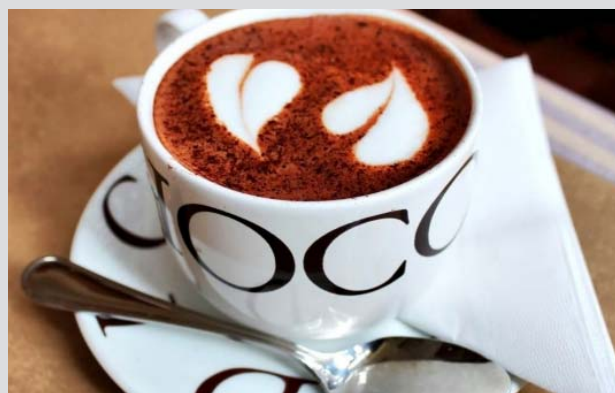
Jeden z warsztatów dotyczył baristyki, a więc wszystkiego, co związane jest z kawą.

Głównym celem projektu było opracowanie nowoczesnego systemu kształcenia, który w sposób elastyczny reagowałby na potrzeby uczniów, firm i przedsiębiorstw w branży turystycznej, hotelarstwie, gastronomii i na rynku pracy na polsko-czeskim pograniczu. Celem projektu było udostępnienie polskim i czeskim uczniom najnowszej wiedzy praktycznej w nawiązaniu do realizacji praktycznych warsztatów prowadzonych przez czołowych specjalistów z branży, stworzenie nowoczesnych materiałów dydaktycznych, wyposażenie pracowni do zajęć praktycznych, pogłębienie współpracy z przedsiębiorstwami oraz zapewnienie ich większego zaangażowania w proces kształcenia w partnerskich szkołach średnich, a także podniesienie atrakcyjności kierunku turystyka, hotelarstwo i gastronomia. W ramach projektu zrealizowano m.in. wspólne warsztaty obejmujące naukę przedmiotów merytorycznych, np. stołowanie, barmanistyka, baristyka, sommelierstwo czy prowadzenie hotelu. Po każdym warsztacie opracowano specjalistyczne studium przypadków, przygotowane we współpracy dydaktyków i lektorów prowadzących poszczególne warsztaty. W ten sposób powstały wartościowe materiały do prowadzenia zajęć w obu szkołach partnerskich.