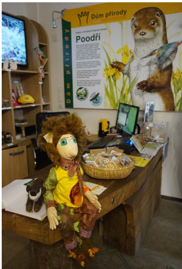
Po domu przyrody nad Odrą małych turystów oprowadza Sówka.

Celem wspólnego projektu gmin Krzyżanowice i Szylerzowice oraz miasta Bogumin, realizowanego w 2017 roku, było uatrakcyjnienie dziedzictwa przyrodniczego polsko-czeskiego pogranicza oraz jego udostępnienie jak najszerzszemu gronu turystów. W ramach projektu, na którego realizację z programu INTERREG V-A Republika Czeska – Polska przyznano dofinansowanie w wysokości 446 166 euro, na przyrodniczym terenie meandrów rzeki Odry zbudowano wieżę widokową, odbudowano część ścieżek edukacyjnych i po obu stronach granicy zbudowano punkty służące bezpiecznemu przechowywaniu rowerów.