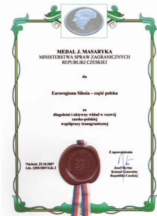
Za wieloletni i aktywny wkład w rozwój czesko-polskiej współpracy transgranicznej polska i czeska część Euroregionu Silesia otrzymała wyróżnienie Ministerstwa Spraw Zagranicznych RCz – Medal Jana Masaryka.

Podstawowe ramy dalszego systematycznego rozwoju współpracy transgranicznej i wspierania działalności podmiotów realizujących współpracę transgraniczną na terenie Euroregionu Silesia wytycza wspólny dokument strategiczny pn. „Strategia Rozwoju Euroregionu Silesia na lata 2014-2020”. Obecnie trwa weryfikacja realizacji tego dokumentu, przeprowadzana jest jego aktualizacja z perspektywą na okres po 2020 roku. Chociaż w tym momencie przygotowania do nowej „europejskiej siedmiolatki”, czyli na nową perspektywę finansową 2012-2027, są dopiero na początku, Euroregion Silesia już dziś analizuje swoje aktualne i przyszłe potrzeby i możliwości, by jego strategiczna wizja była „prosperującym polsko-czeskim regionem, który wspiera ideę jedności europejskiej oraz wspólnie rozwijającym swoją przyszłość w oparciu o współpracę partnerską” nie była tylko gołosłowną definicją zapisaną na papierze.