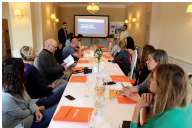
Z warsztatów z zarządzania produktami turystycznymi – Szlak zabytków techniki województwa śląskiego.

Już dziś zapraszamy do polubienia naszego profilu na FB „Wspólne dziedzictwo / Společné dědictví”, a niebawem do zapoznania się z tworzoną stroną www.tourism-pl-cz.eu .