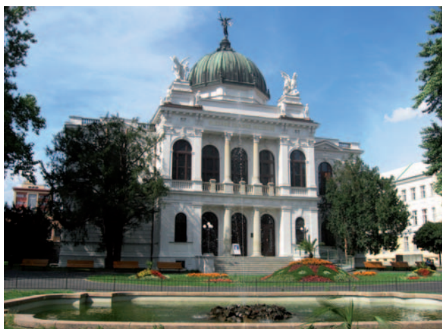
Muzeum Ziemi Śląskiej w Opawie, założone w 1814 roku, jest najstarszym muzeum na terenie Republiki Czeskiej.

Euroregion Silesia w swojej nazwie nawiązuje do łacińskiej nazwy Śląska – SILESIA. Śląska, który jako kraina historyczna obejmuje obszar leżący obecnie na terenie trzech państw: Polski, Republiki Czeskiej i w niewielkim zakresie Niemiec. Obszar Śląska przedstawia się często jako liść dębu, którego unerwienie stanowi rzeka Odra w jej górnym i środkowym biegu oraz jej dopływy. W tym szkicu postaramy się pokazać, jak doszło do tego, że ten dębowy liść „rozerwany” jest dziś pomiędzy Polską i Republiką Czeską. Skupimy się oczywiście na polsko-czeskim, czy ściślej rzecz biorąc, śląsko-morawskim pograniczu, czy obszarze, który dziś w dużej mierze pokrywa się z obszarem Euroregionu Silesia.