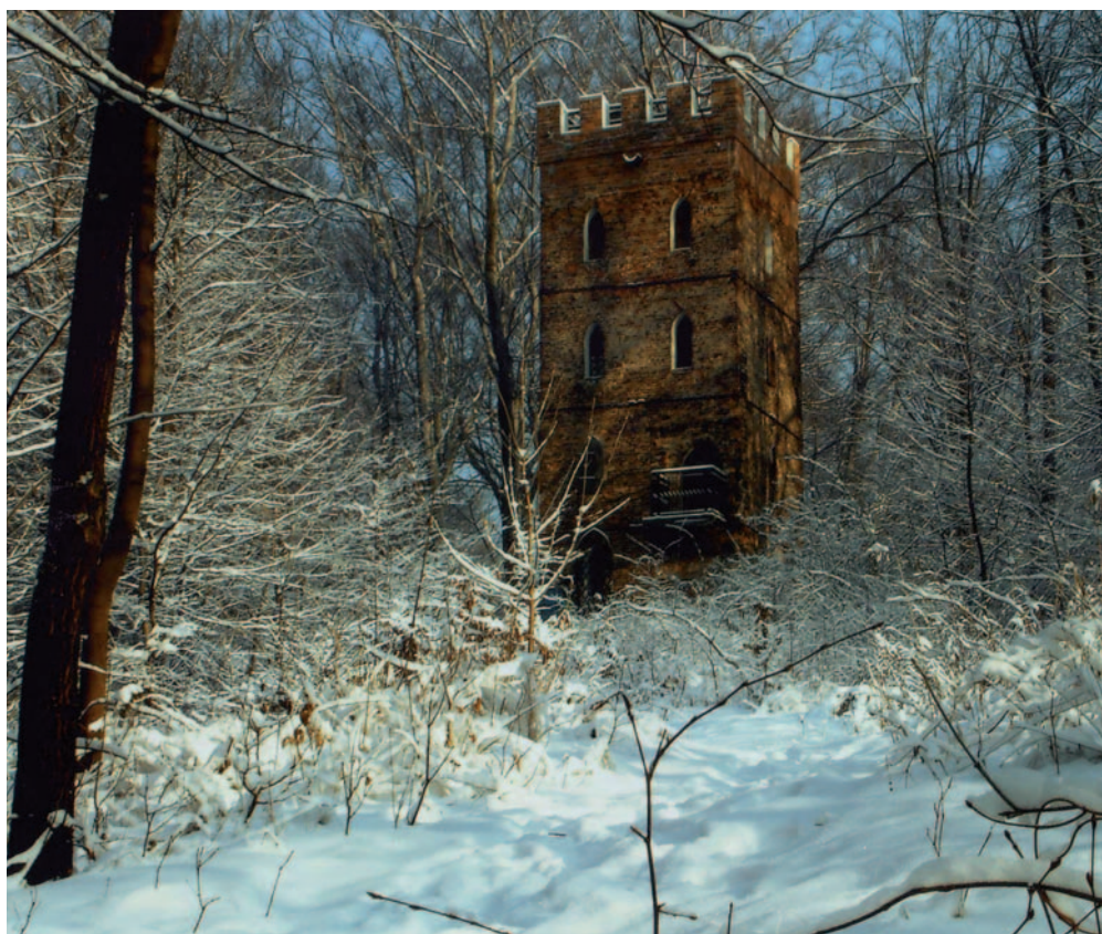
Baszta Rycerska w Wodzisławiu Śląskim zostanie udostępniona turystom po modernizacji zaplanowanej na lata 2020-2021.

jących ramy Funduszu Mikroprojektów. Dlatego też będą one częścią dużego projektu tzw. „Silesianki”. Poza tym ktoś musi czuwać nad całością, ktoś, kto popatrzy na pojedyncze wieże i platformy, jako na „produkt turystyczny”, dzięki któremu można będzie wykorzystać potencjał całego obszaru Euroregionu Silesia. Oczywiście byłoby, że będziemy to my, dwa Stowarzyszenia tworzące Euroregion Silesia.