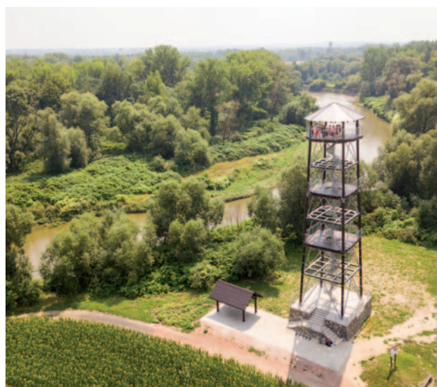
Z wieży widokowej w Krzyżanowicach – Chałupkach (27 m) roztacza się widok na rzekę Odrę i jej meandry.