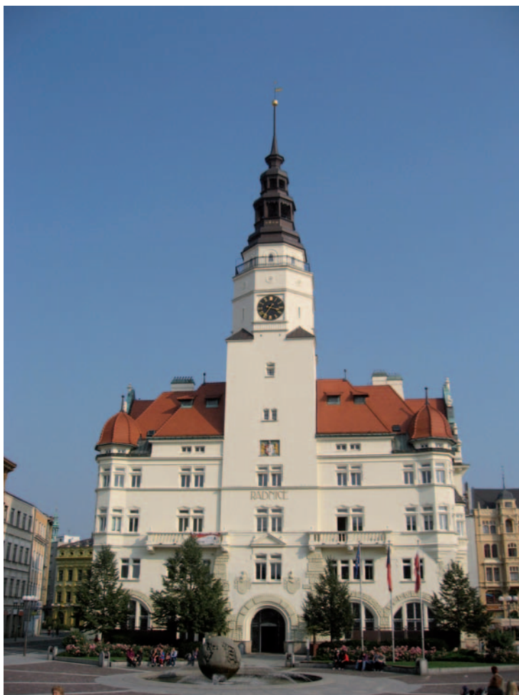
Miejska wieża, nazywana „Hlaska”, zbudowana w latach 1614-1618, jest symbolem miasta Opawy. Mieści się tu urząd miasta oraz biuro czeskiej części Euroregionu Silesia. Wieża jest ogólnie dostępna.

Po wstępnej weryfikacji w ramach tworzonej Strategii było wiadomo, że jest już kilka na naszym obszarze istniejących i funkcjonujących turystycznie wież i platform. Wszystkie funkcjonowały jednak, jako „oddzielne” atrakcje, niepołączone w jedną całość. Okazało się również, że wiele naszych gmin chce budować nowe wieże i platformy lub rekonstruować istniejące obiekty w celu udostępnienia turystycznego. I tak od 2016 roku w ramach Funduszu Mikroprojektów w Euroregionie Silesia przygotowano 3 grupy projektów (etapy I, II i III) tj. łącznie 11 wniosków na „małe wieże i platformy”, ale małe tylko kwotowo, bo idea jest jedna – wielka. Kolejne wieże jak ta w Wodzisławiu Śląskim, Budiszowie nad Budiszówką, czy w Jeseniku nad Odrą wymagają większych nakładów finansowych, przekracza-